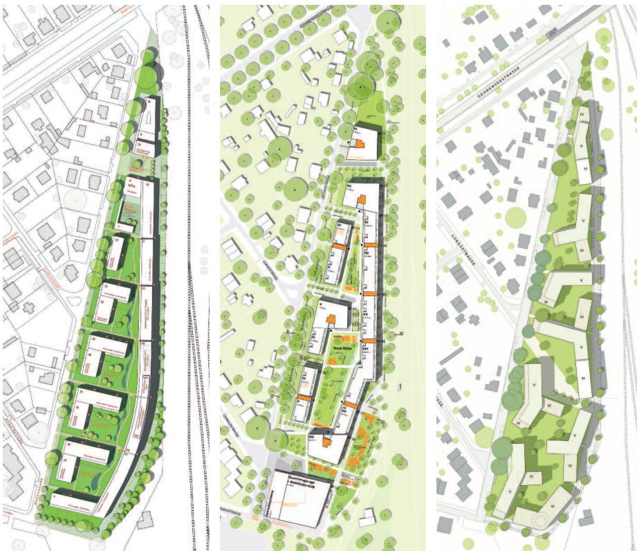
2. Preis PSP Weltner Louvieux, Berlin