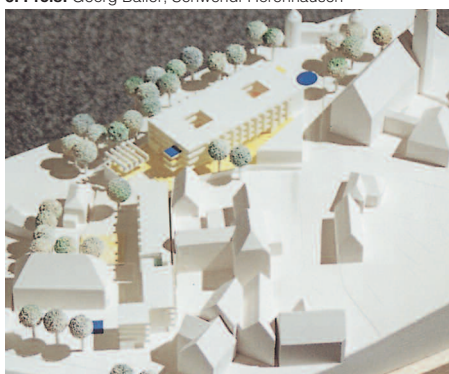
Ankauf: Müller · Djordjevic-Müller, Stuttgart