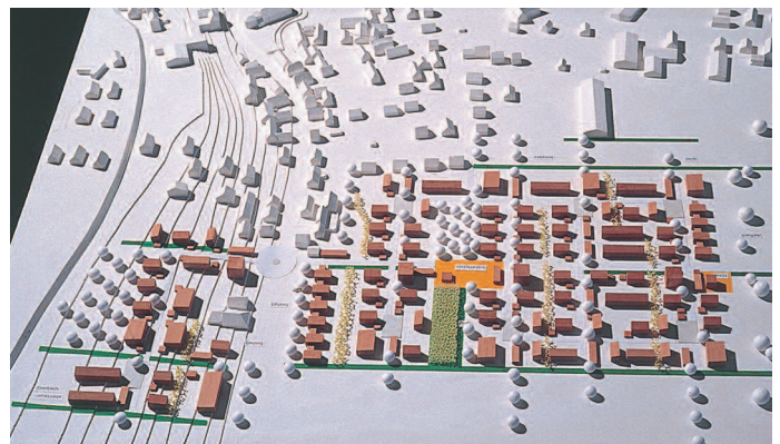
Ankauf: Becker + Haindl, Stuttgart