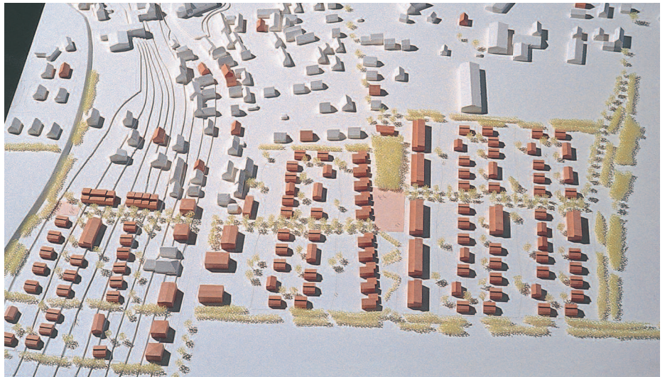
4. Preis: Volker Rosenstiel, Freiburg