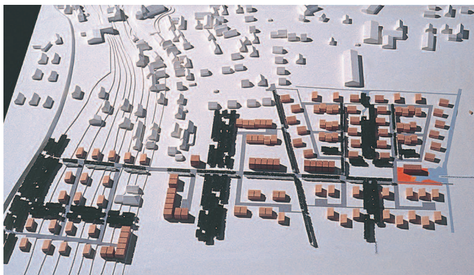
Ankauf: PGZ Planungsgruppe Zürcher, Meissenheim