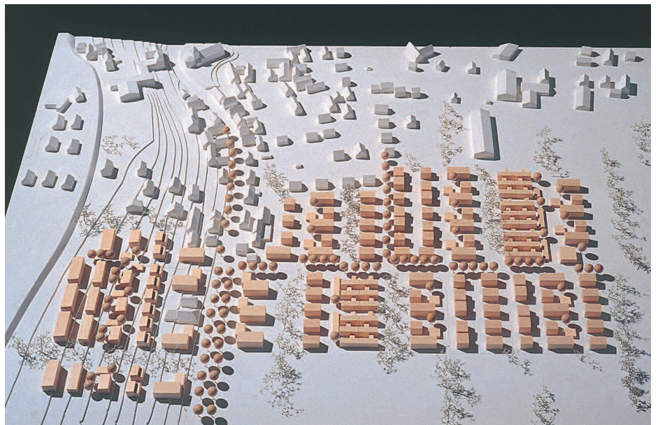
2. Preis: Elmar Gross, Stuttgart