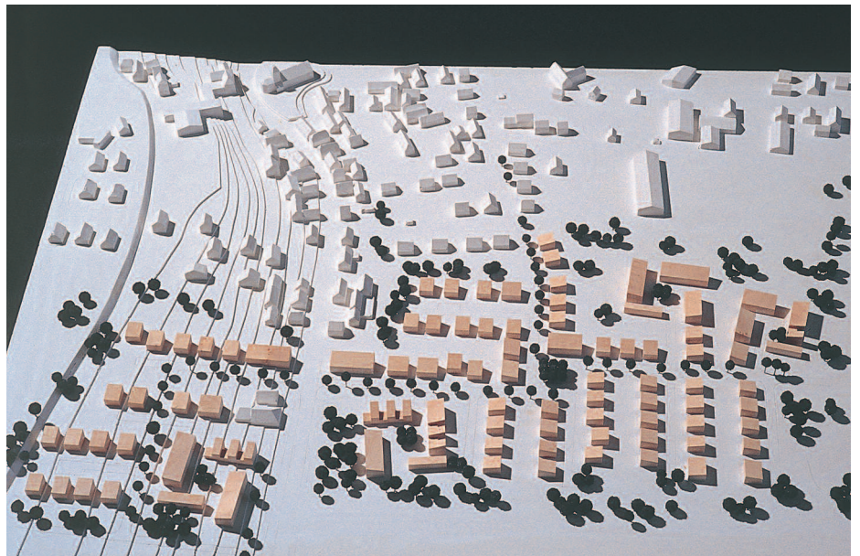
1. Preis: Architektengruppe Stadtraum, Düsseldorf