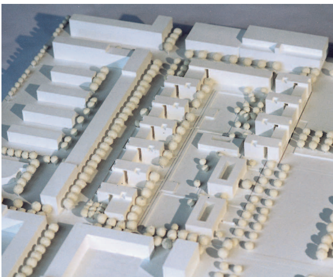
1. Ankauf: Röpke Architekten, München