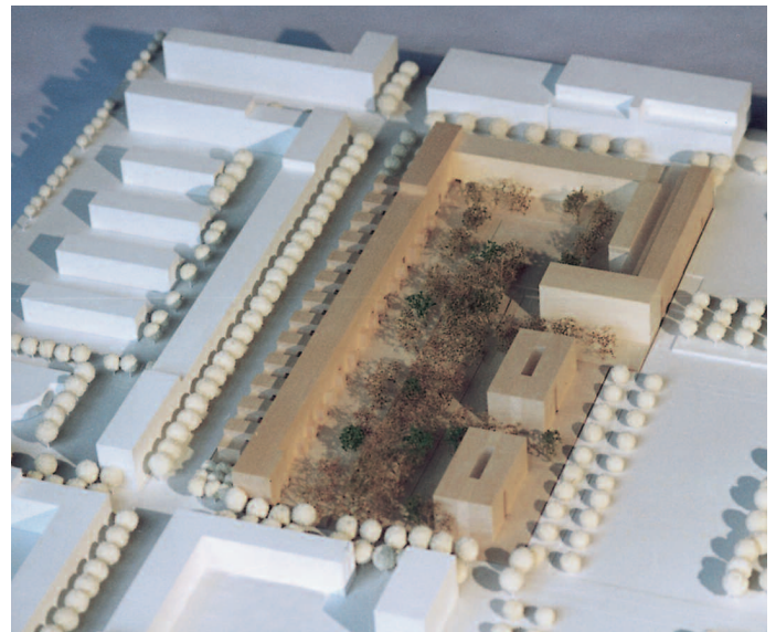
Preis: Reiner + Weber, München · Fischer + Steiger, München