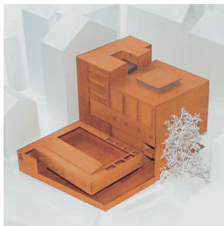
4. Preis: Michael Wilford GmbH, Stuttgart