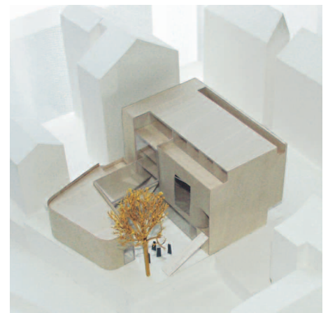
1. Preis: Seibold + Bloss, Waiblingen