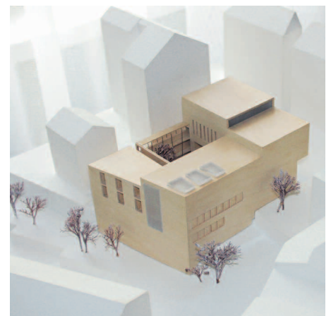
1. Ankauf: Bez + Kock, Stuttgart