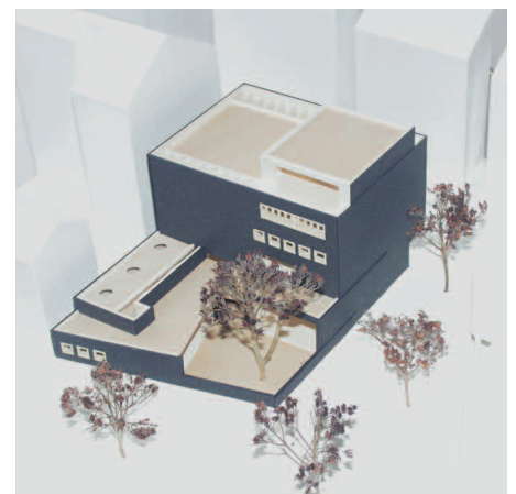
3. Preis: Wunderlich Architekten, Esslingen