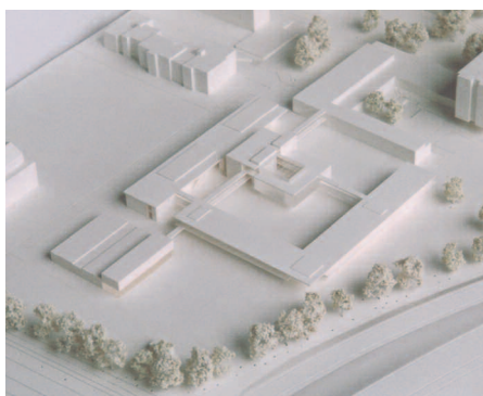
3. Ankauf: Wolfram Wöhr, München