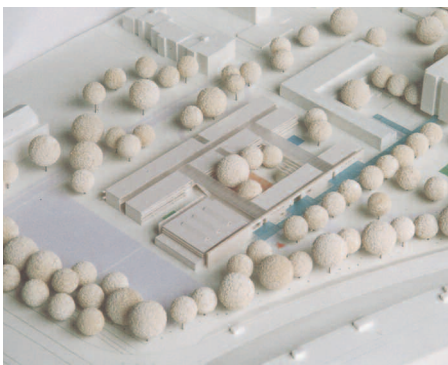
4. Preis: Arat – Siegel & Partner, Stuttgart