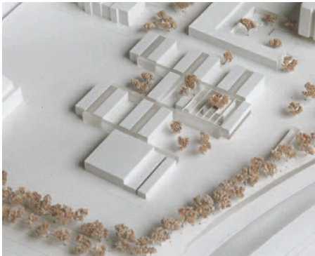
1. Preis: Gierstorfer · Köstlbacher · Miczka, Regensburg

Das Preisgericht empfiehlt dem Auslober den Verfasser des 1. Preises mit der weiteren Bearbeitung der Planung zu beauftragen.