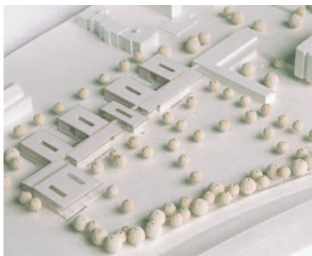
5. Preis: Erich J. Gruber · Erich Gruber jun., Straubing