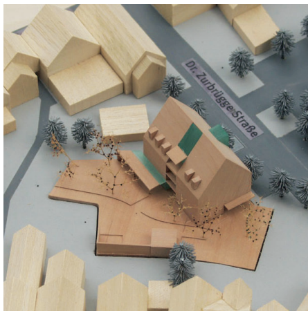
2. Preis/2nd Prize Dohle + Lohse Architekten, Braunschweig