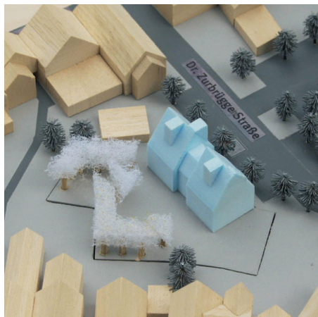
1. Preis/1st Prize szaramowicz architektur, Neuss

There should be 11 singleapartements (40 sqm) and one bigger appartement for two as well as meeting rooms. In total 11 handicapped people will live there for good. Additionally one living room is thought for short time users.