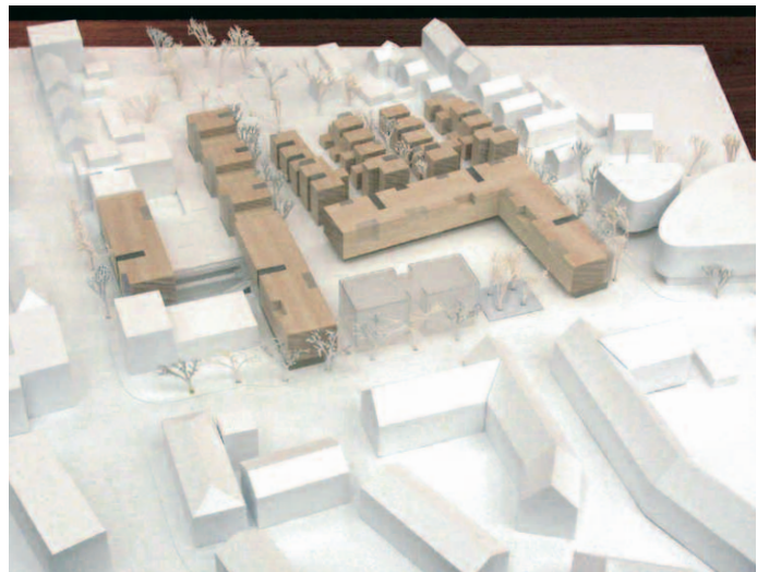
3. Preis: voigt und herzig GmbH, Darmstadt · Drees & Sommer GmbH, Frankfurt