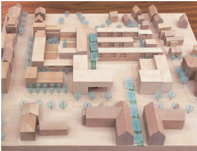
1. Preis: ELING architekten, Lippstadt · Hochtief Projektentw. GmbH, Offenbach

Das Preisgericht empfiehlt der Ausloberin einstimmig, mit der dem ersten Preis ausgezeichneten Arbeitsgemeinschaft Verhandlungen über die weitere Bearbeitung der Entwurfsaufgabe zu verfolgen und Verhandlungen über den Kauf der Grundstücke aufzunehmen.