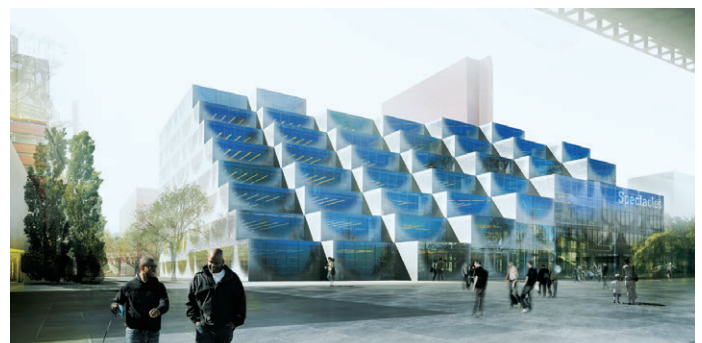
3. Preis/3rd Prize A+ Production, Frankreich · Morens Architecture et Associés, Luxemburg