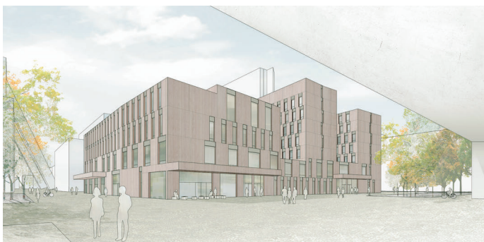
3. Preis/3rd Prize Von Ballmoos · Krucker, Schweiz · Michel Petit, Luxemburg