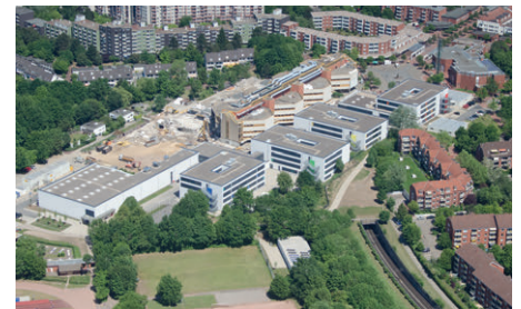
1. BA 2015 vor Abriss des Altbaus