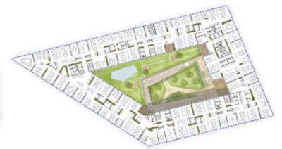
Regelgeschoss 3. OG