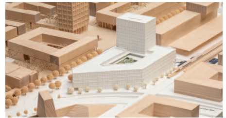
2. Preis ASTOC, Köln · mahl gebhard, München