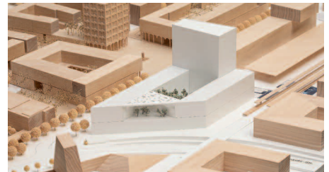
3. Preis Grüntuch Ernst, Berlin · WES LandschaftsArch., Berlin