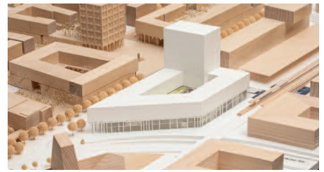
1. Preis kadawittfeldarchitektur · Auböck + Kárász, Wien

1. Preis /1st Prize kadawittfeldarchitektur, Aachen · Auböck + Kárász, Wien