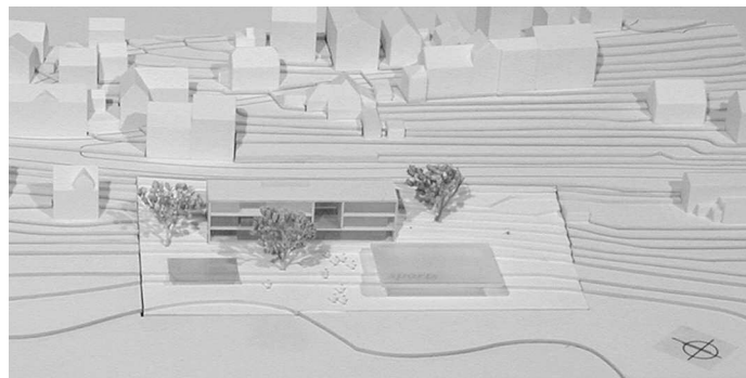
Ankauf: Mahler · Günster · Fuchs, Stuttgart