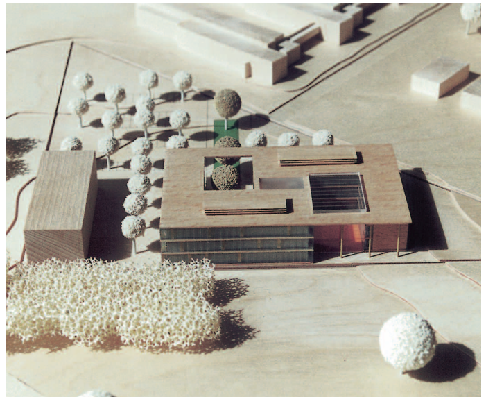
2. Preis: Ulrich Schünemann, Lübeck