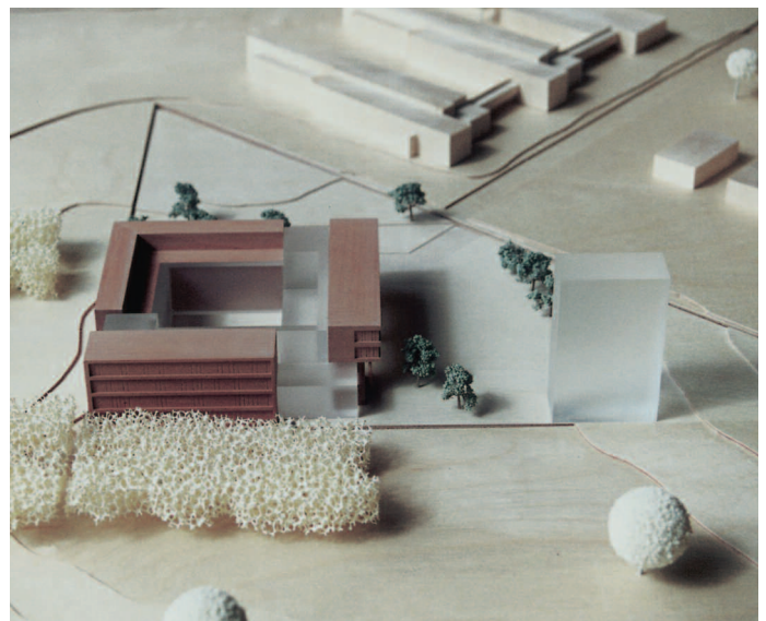
4. Preis: Heinle, Wischer und Partner, Berlin