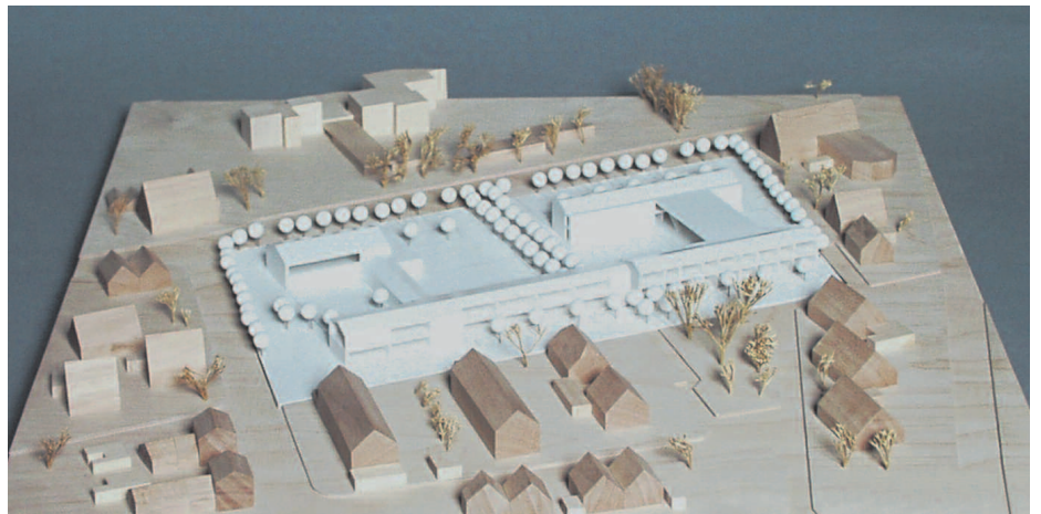
3. Preis: Klaus Gonser, Münster