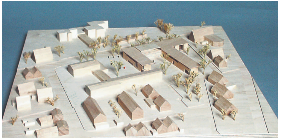
Ankauf: Architekten Abdelkader, Münster

Das neue Schulgebäude ist auf die vorhandene Freifläche der südlichen Grundstückshälfte der Annette-Schule zu plazieren. Es ist beabsichtigt, den 2-geschossigen südlichen Gebäude-trakt, sowie den 1-geschossigen Mehrzweckraum der Annette-Schule abzubauen. Die Janusz-Korczak-Schule umfasst 322 m 2 Allgem. Unterrichtsbereich, die Wilhelm-Busch-Schule 882 m 2 . Der gemeinsam genutzte Bereich umfasst ca. 571 m 2 .