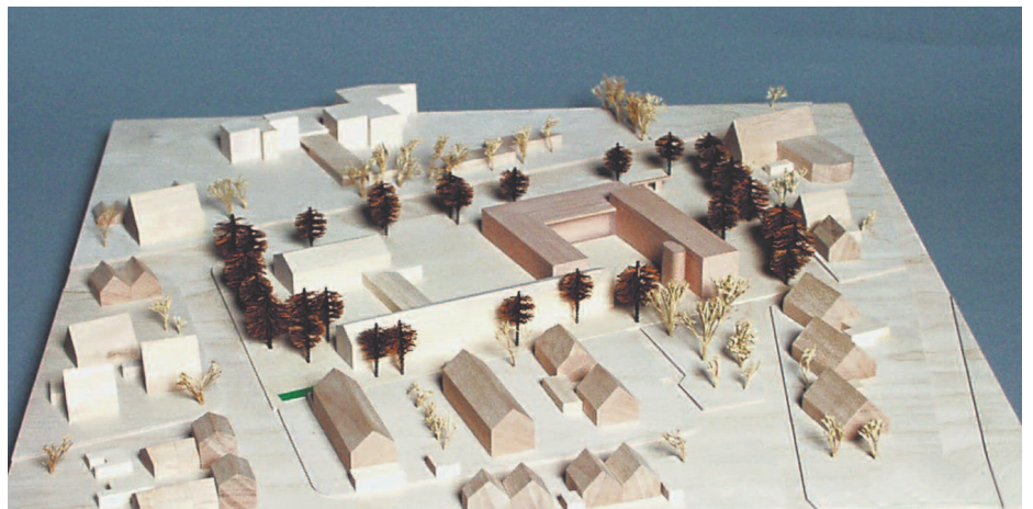
4. Preis: Klaus Burhoff & Beate Burhoff-Dömer, Münster