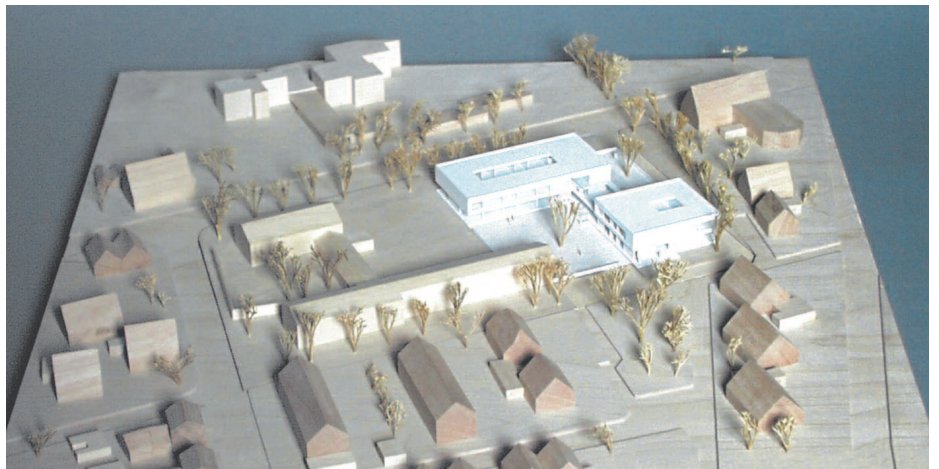
Ankauf: Behet &amp; Bondzio, Münster