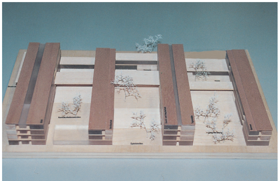
3. Preis: Krug & Partner, München · Fischer Projektmanagement