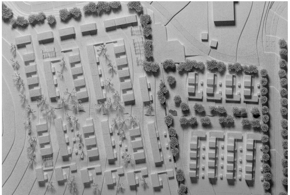
2. Preis: Schulze + Partner, Augsburg