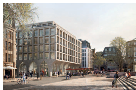
3. Preis/3rd Prize caspar.schmitzmorkramer gmbh, Köln