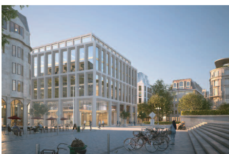
2. Preis/2nd Prize Henning Larsen GmbH, München