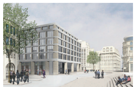
Anerkennung/Mention Schilling Architekten, Köln