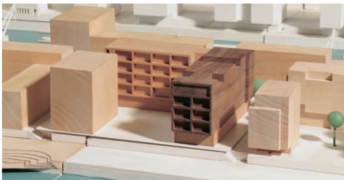
1. Preis Gebäudewinkel: SEHW Architekten, Hamburg

Das Preisgericht empfiehlt dem Auslober, die Realisierung des ersten Preises intensiv zu überprüfen.