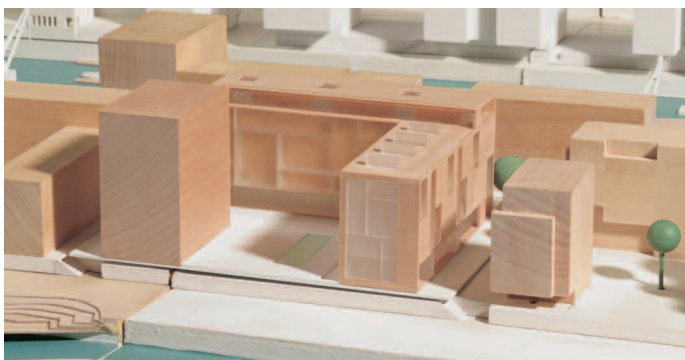
3. Preis Gebäudewinkel: APB. Architekten, Hamburg