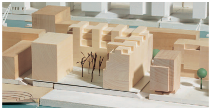
2. Preis Gebäudewinkel: Léon Wohlhage Wernik Architekten mit H.J. Lankes, Berlin