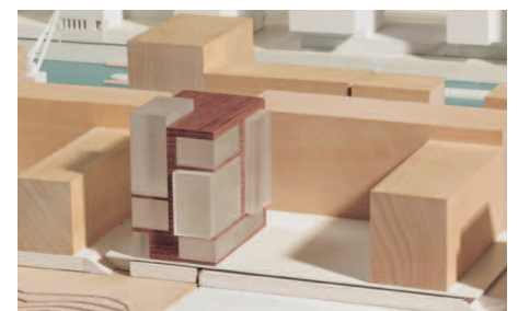
3. Preis Solitär: renner · hainke · wirth architekten, Hamburg