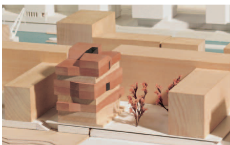
1. Preis Solitär: SML Architekten, Hamburg