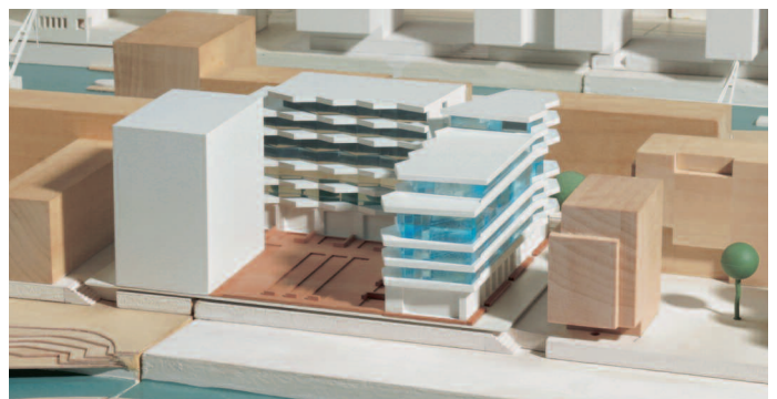
4. Preis Gebäudewinkel: msm meyer schmitz-morkramer, Darmstadt