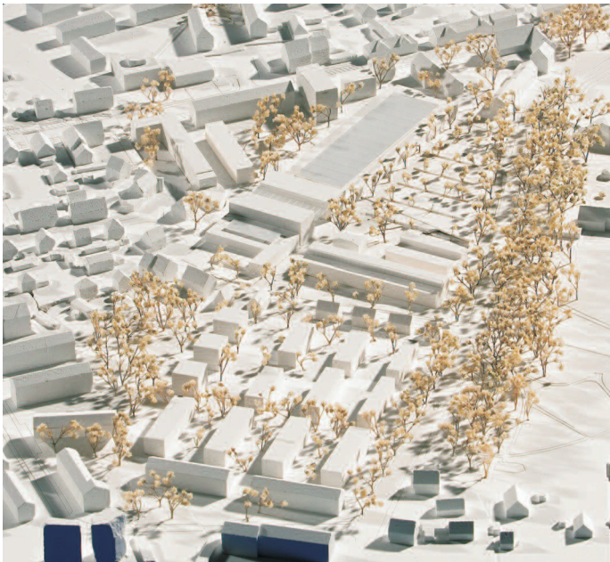
2. Preis SEP Baur & Deby Architekten und Stadtplaner, München