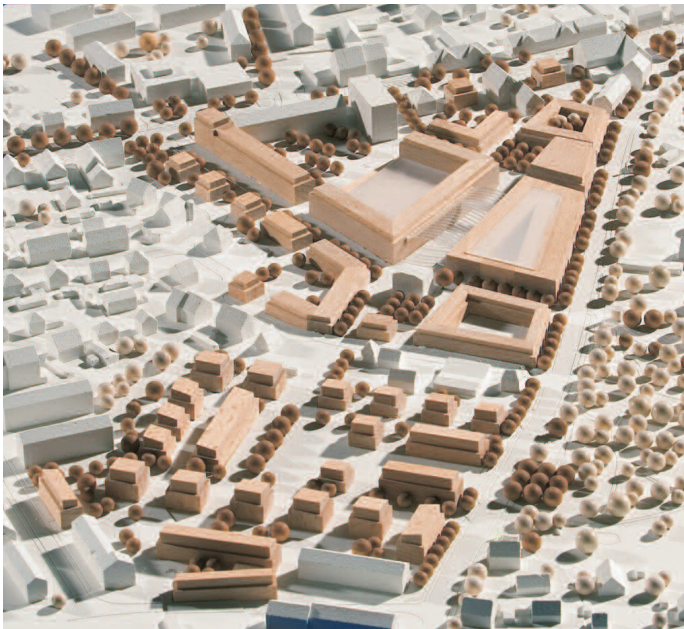
Ankauf HJP Planer, Aachen · Lützw 7, Berlin