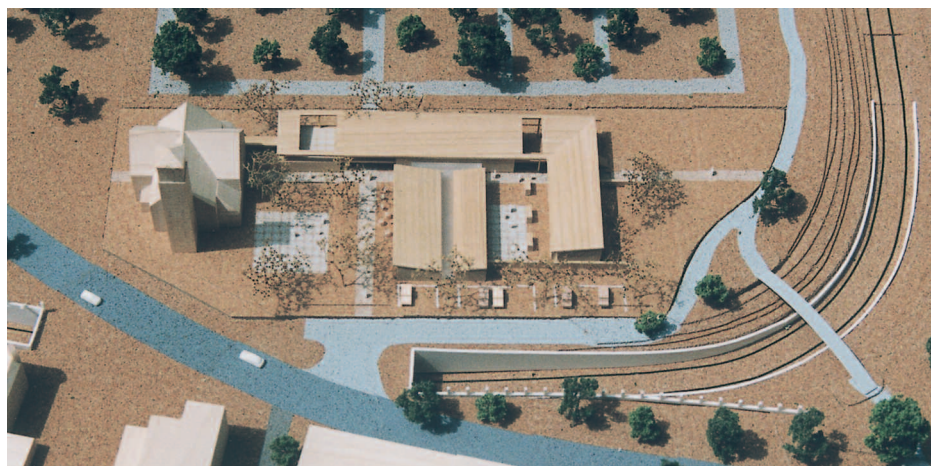
Ankauf: Heinrich & Wörner & Partner, Dortmund