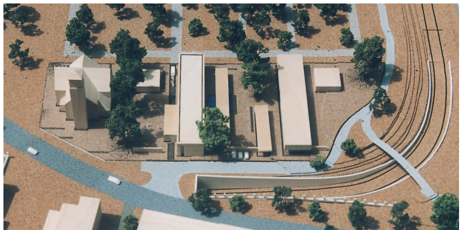
2. Preis: Daum Architekten, Bielefeld