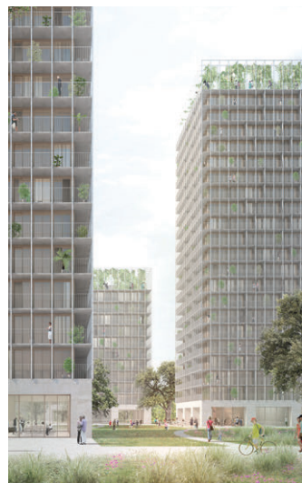
3. Preis Kuehn Malvezzi, Berlin Atelier Kempe Thill, Rotterdam