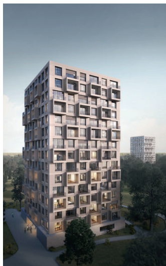
2. Preis Kleihues & Kleihues, Berlin