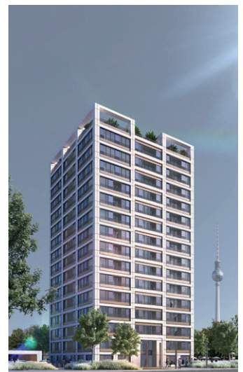
Anerkennung gmp, Architekten von Gerkan, Marg und Partner, Hamburg