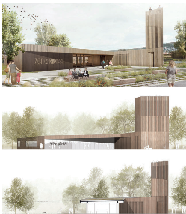
2. Preis TRU Architekten Töpfer, Bertuleit, Ruf, Lingens, Bauerfeind, v. Wedemeyer Partnerschaft mbB, Berlin