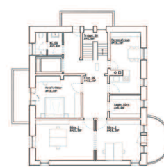
Grundriss 1. Obergeschoss