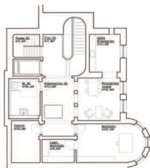
Grundriss 1. Kellergeschoss