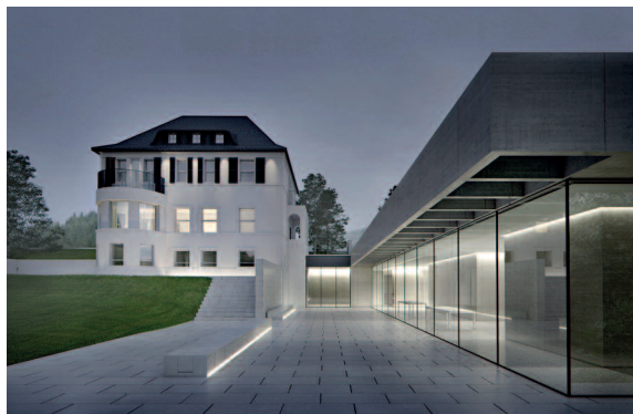
Gartenblick auf Neu- & Altbau