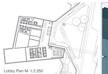
Lobby Plan M. 1:2.250