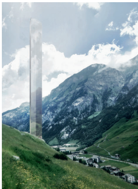
Drawings/Images: Courtesy of Morphosis Architects