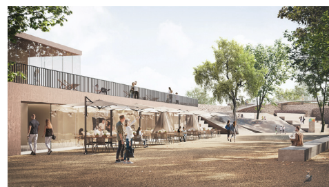
Blick auf das Areal aus der Fußgängerperspektive

LOMA architecture landscape.urbanism, Kassel Brunnhöfer + Vukorep + Schück Architekten Landschaftsarchitekt Stadtplaner, Kassel Kommunikationsdes.: chezweitz GmbH, Berlin