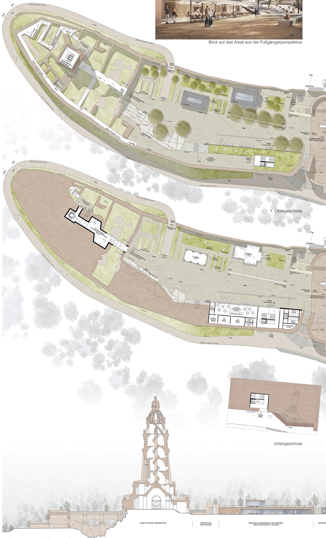
1. Preis/ 1st prize Code Unique Architekten, Dresden · RSP Freiraum GmbH, Dresden · VOR GmbH, Dresden