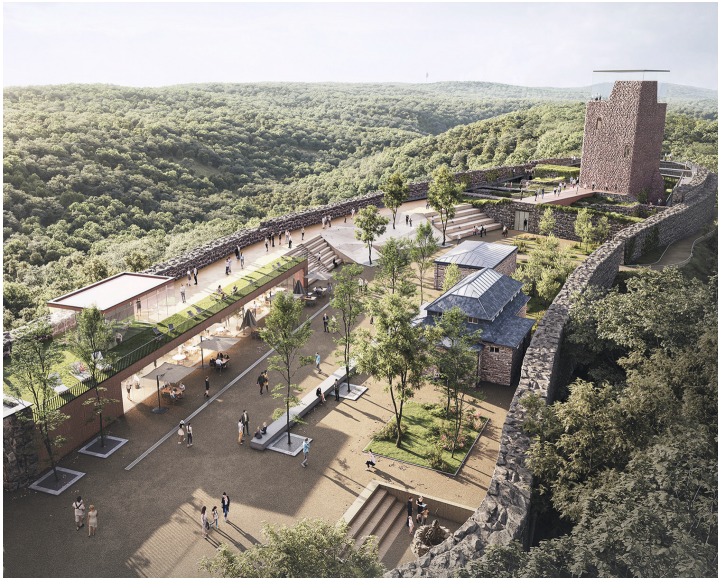
Blick auf das Areal aus der Vogelperspektive