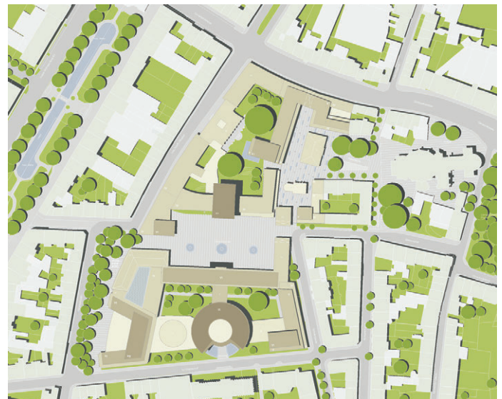
2. Preis/2nd Prize Steidle Architekten, München