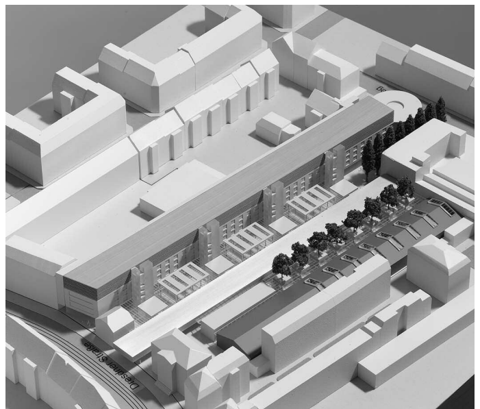
1. Preis: HPP Hentrich-Petschnigg & Partner KG, Leipzig