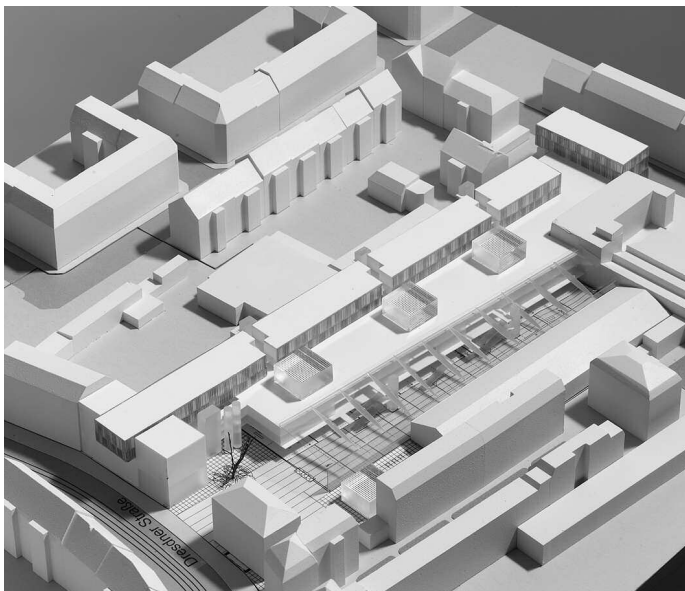
2. Preis: ATP – Achammer · Tritthart & Partner, München