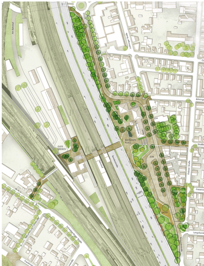
1. Preis /1st Prize Glück Landschaftsarchitektur, Stuttgart