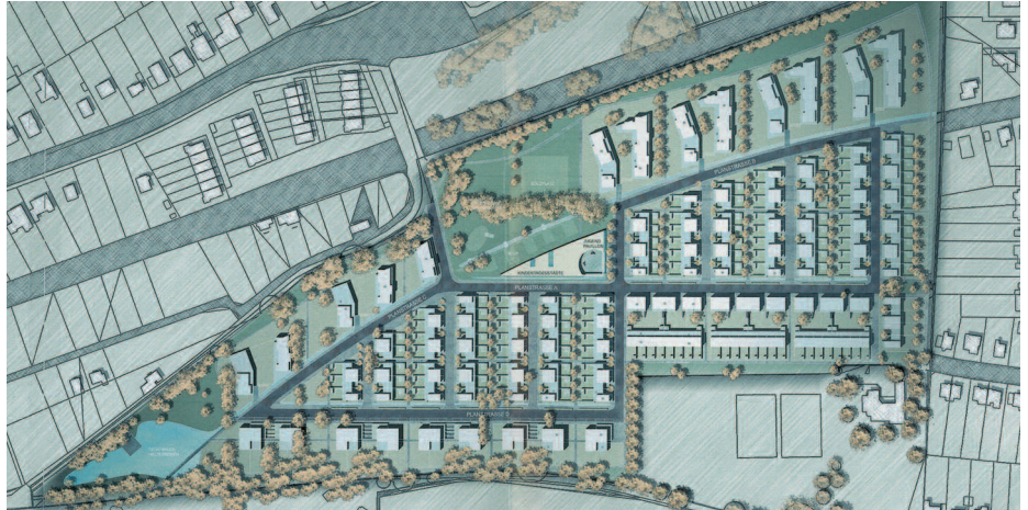
5. Preis: Nietz · Prasch · Sigl · Tchoban · Voss, Hamburg; H.O. Dieter Schoppe, Hamburg

Das Preisgericht empfiehlt dem Auslober, die jeweils mit dem 2. Preis prämierten Arbeiten durch ihre Verfasser überarbeiten zu lassen und anschließend zu entscheiden, welches Konzept weiterverfolgt werden soll. Bei dieser Entscheidung sollten möglichst viele Mitglieder des Preisgerichts mitwirken. Vorher sollten mit den Verfassern in einem persönlichen Gespräch die Kritikpunkte und die Aufgabenstellung für die Überarbeitung erörtert werden.