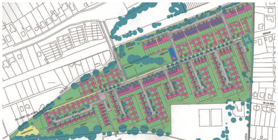
2. Ankauf: Wischhusen, Hamburg; Wiggenhorn + van der Hövel, Hamburg