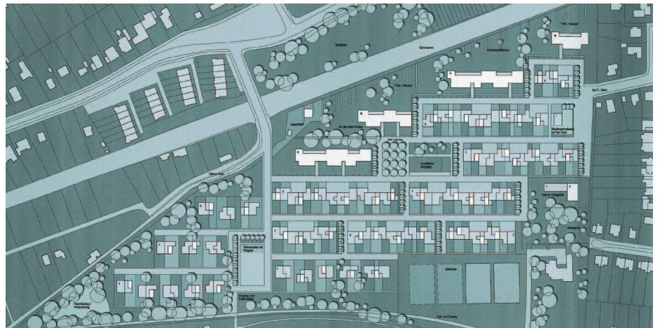
2. Preis: Beyer + Schubert, Berlin; Gerhard Kapeller, Berlin