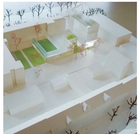
2. Preis/2nd Prize Bizer + Herker Architekten, Stuttgart