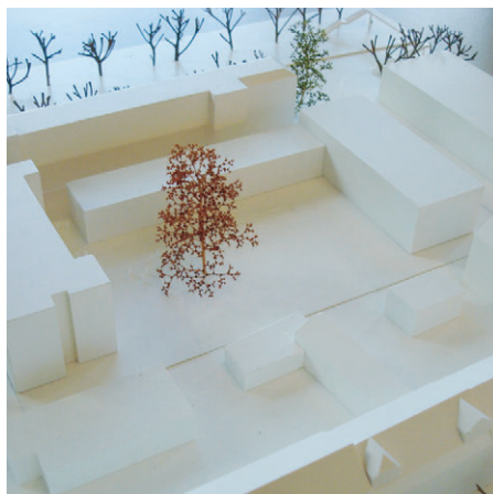
Ankauf/Mention Puppenthal Architekten, Olfen