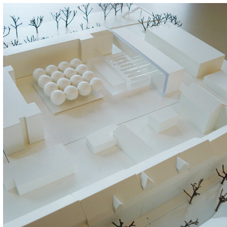
5. Preis/5th Prize ASPALN Architekten, Kaiserslautern