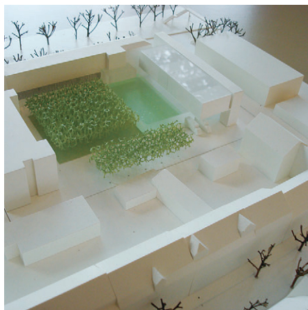
3. Preis/3rd Prize Prof. Focht und Partner GmbH, Saarbrücken