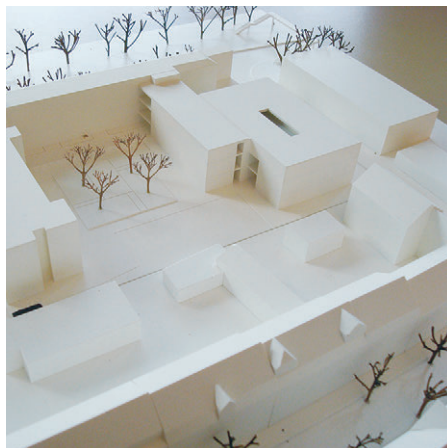
1. Preis/1st Prize Raimar Herbst Architekten, Berlin