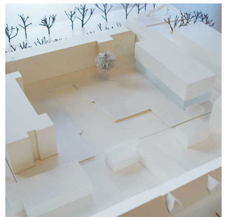
Ankauf/Mention gildehaus.reich architekten, Weimar