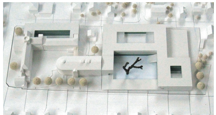
4. Preis/4th Prize Knoche Architekten, Leipzig