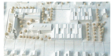
Ankauf/Mention Translocal Architecture, Dresden