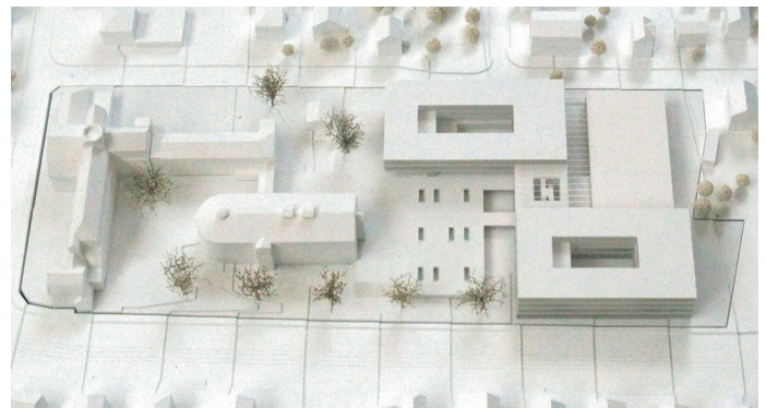
2. Preis/2nd Prize vögele architekten, Stuttgart