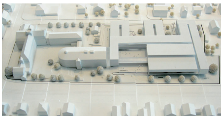
Ankauf/Mention Lamott Architekten, Stuttgart