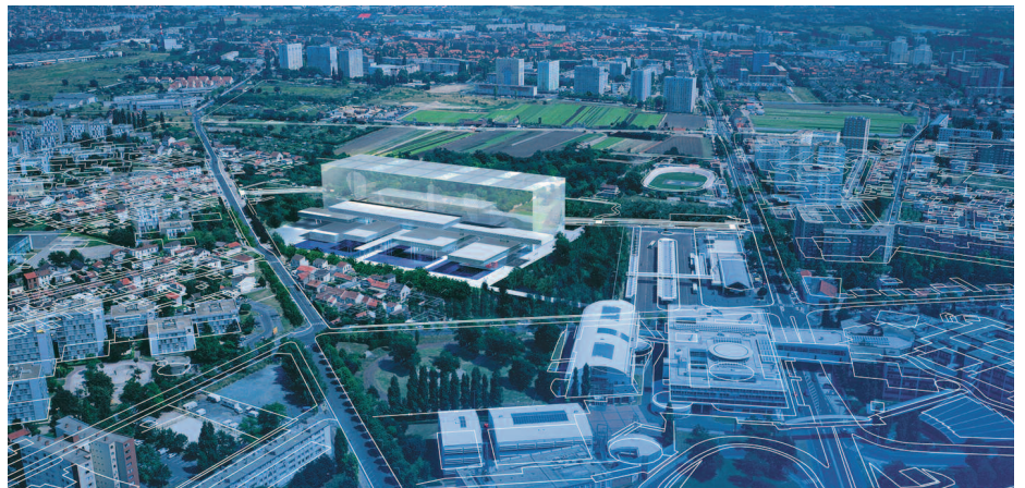
1. Preis: Massimiliano Fuksas, Rom/Paris