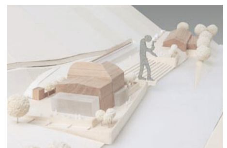
Sonderanerkennung/Mention B.A.S., Weimar