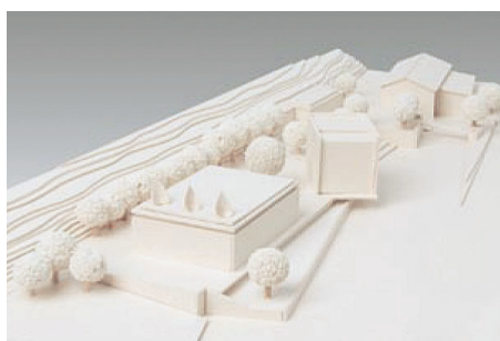
3. Preis/3rd Prize Hendrix Architektur Städtebau, Duisburg