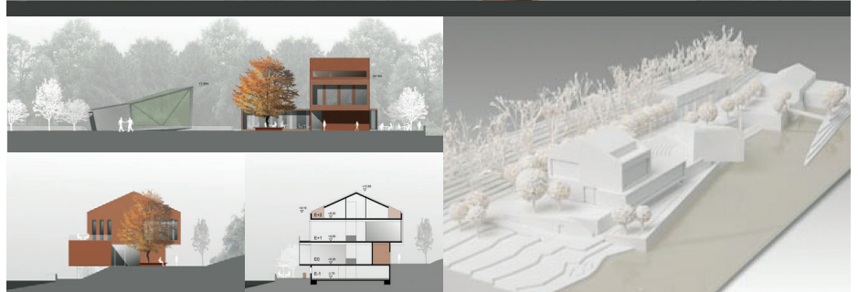
1. Preis/1st Prize Pool 2 Architekten, Kassel