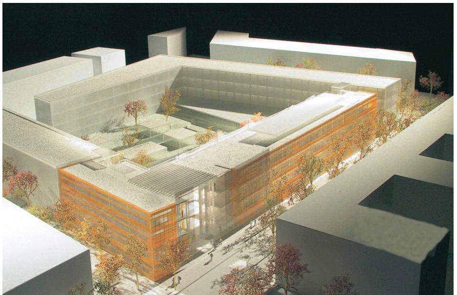
2. Preis: Heinle · Wischer & Partner, Stuttgart