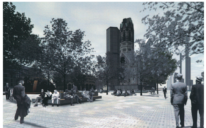
2. Preis: TOPOTEK 1 – Martin Rein-Cano, Berlin