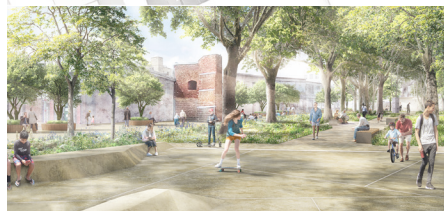
Untere Platzfläche Blickrichtung Norden