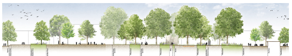
1. Preis /1st Prize KRAFT.RAUM. Landschaftsarchitektur und Stadtentwicklung, Düsseldorf