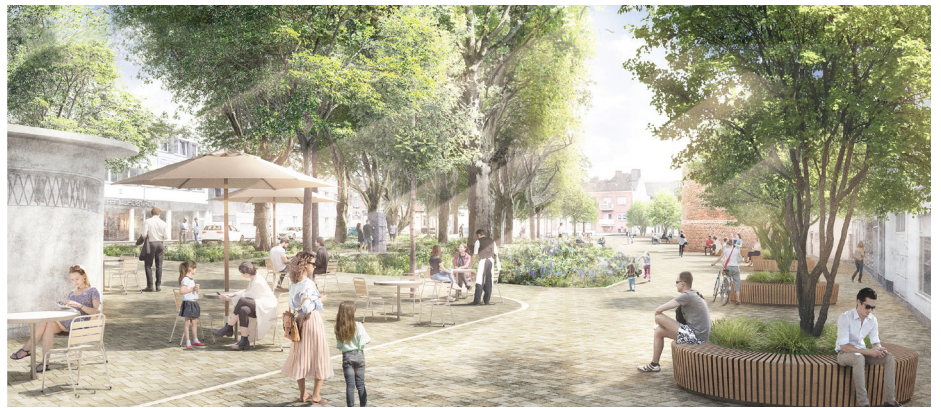
Obere Platzfläche Blickrichtung Norden