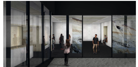
Kunststandort 2 aus dem Innenhof mit geöffneter Schiebetür