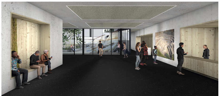
Foyer mit Kunststandorten 1, 2 und 3

1960 wurde das Bauhaus-Archiv als Verein gegründet; 1979 eröffnete das mittlerweile denkmalgeschützte Museumsgebäude am Berliner Landwehrkanal. Um die Sammlung umfassender präsentieren zu können, erhält das Bauhaus-Archiv Berlin einen Museumsneuba, mit diesem werden die Funktionen des Bauhaus-Archivs als Museums- und Archivbetrieb zukünftig auf zwei Gebäude verteilt ( wa-2013867 ). In Verbindung mit der Baumaßnahme lobt das Land Berlin einen Kunstwettbewerb aus. Ziel und Aufgabe war es, einen künstlerischen Entwurf zu erarbeiten, der sich mit der Architektur, dem räumlichen Kontext und der Nutzung als Museum und Archiv auseinandersetzt – einem Ort für kreatives Lernen, interdisziplinären Austausch und kritischen Dialog.