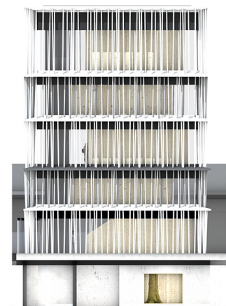
Schnitte durch Turm und Foyer