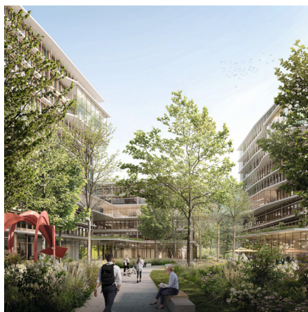
Gewinner /Winner Behnisch Architekten, München · Adler Olesch L.Arch., München