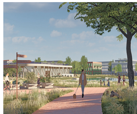
Der bestehende Weg in der grünen Aktivitätsachse verbindet die grünen und blauen Biotope und die Landschaft mit der Stadt