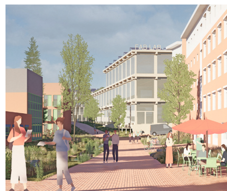
Die bestehende Straße entwickelt sich in einen Gemeinschaftsraum