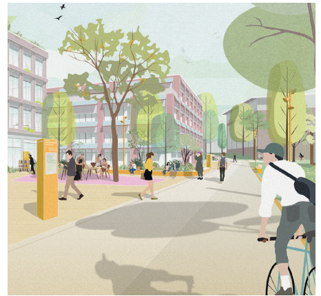
Urbane Platz an der Campus-Schleife im Bereich der Hochschule