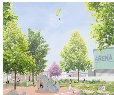
Entrée Südwest Sportcluster