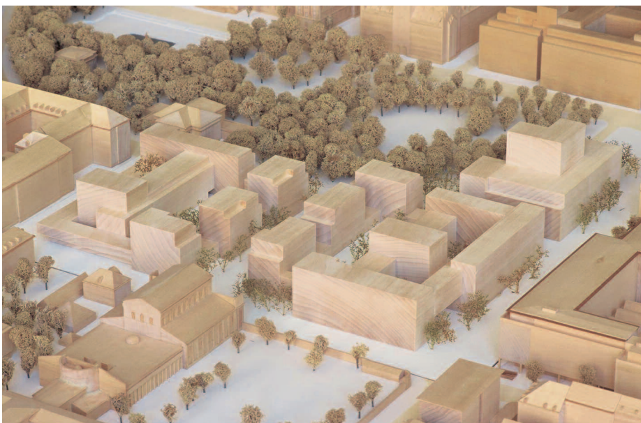
2. Rang: Steidle + Partner Architekten, München · realgrün Landschaftsarchitekten, München