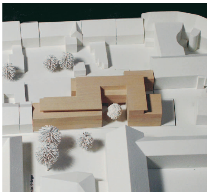
3. Preis: Steidle + Partner, Simbach/Inn