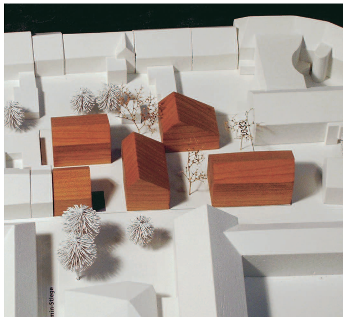
1. Preis: Gruppe MDK, Münster · FSW Fenner · Steinhauer + Weiser, Düsseldorf