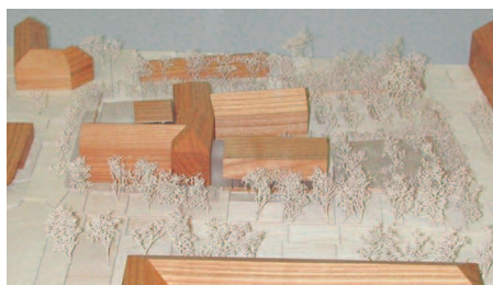
1. Preis: HKS Architekturwerkstatt, Erfurt