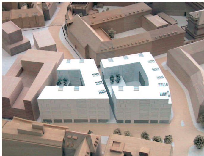
2. Preis: Staab Architekten, Berlin