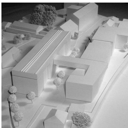
Ankauf: Molzbichler + Ruczka ZT GmbH, Wien