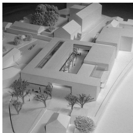
Ankauf: Schwebel Architekten, Berlin