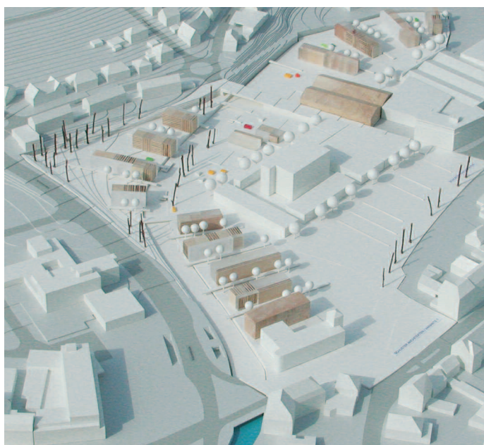
3. Preis: Schuster Architekten, Düsseldorf