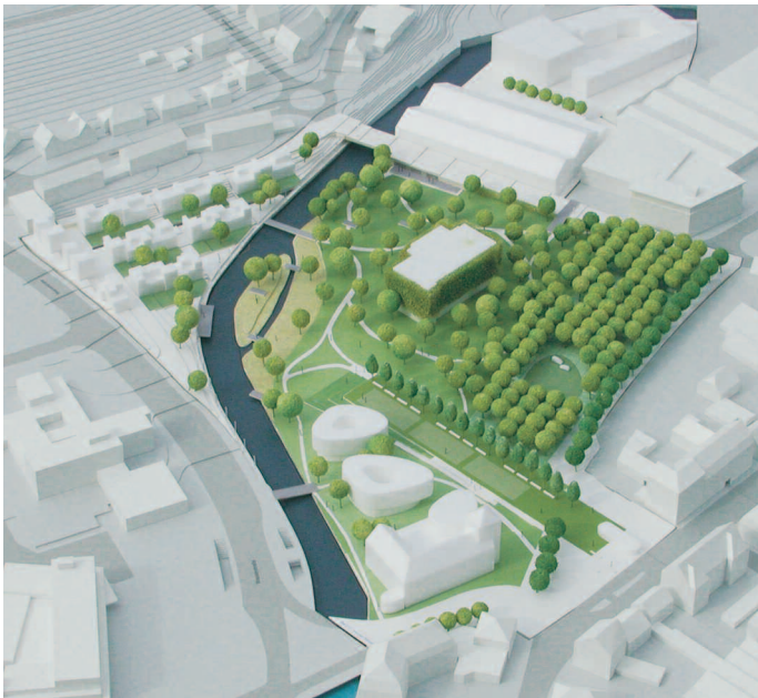
1. Preis: rha Reicher · Haase, Aachen · lad + I Diekmann, Hannover