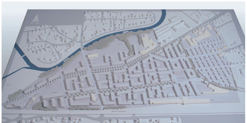
Anerkennung: Glück + Partner, Stuttgart