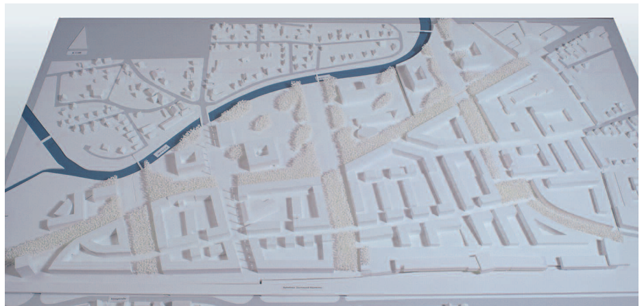
1. Preis: Kohne und Neideck, Karlsruhe · Klahn + Singer + Partner, Karlsruhe