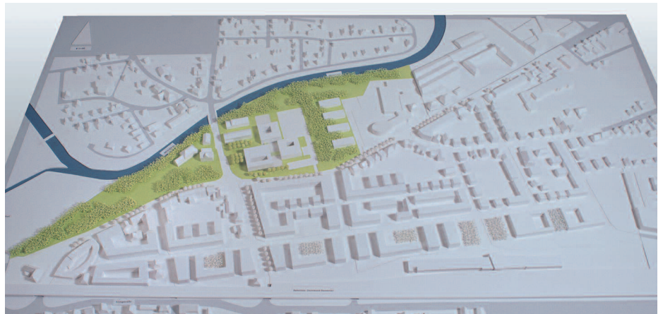
2. Preis: Hausmann + Müller, Köln