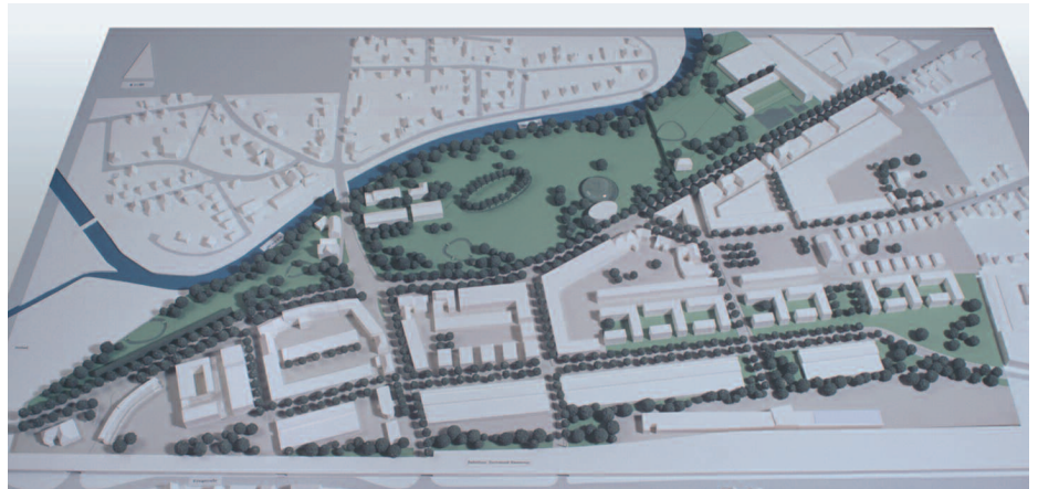
3. Preis: Bollmann · Friedemann, Hannover · Lad + landschaftsarchitektur diekmann, Hannover