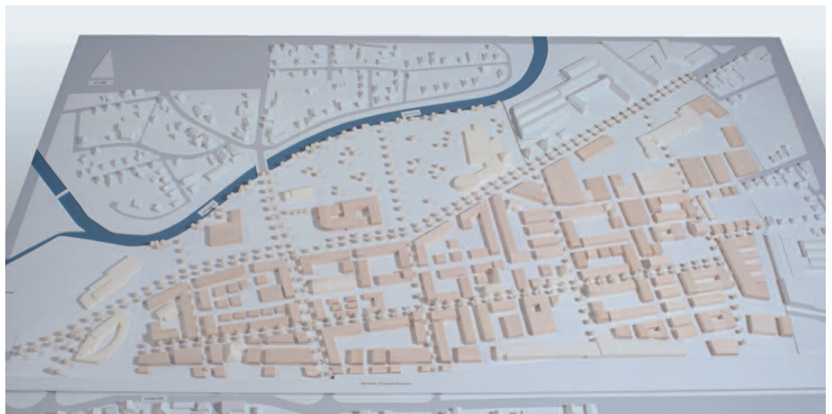
Anerkennung: O.M. Architekten, Braunschweig · St Raum a, Berlin