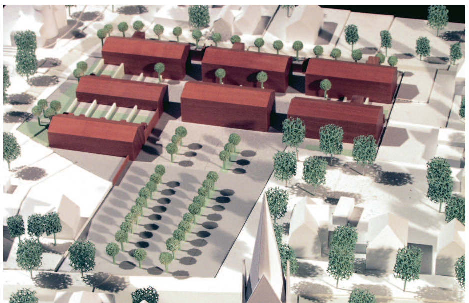
Anerkennung: Prof. Spital-Frenking und Schwarz, Lüdinghausen · Echterhoff Projektentwicklung GmbH