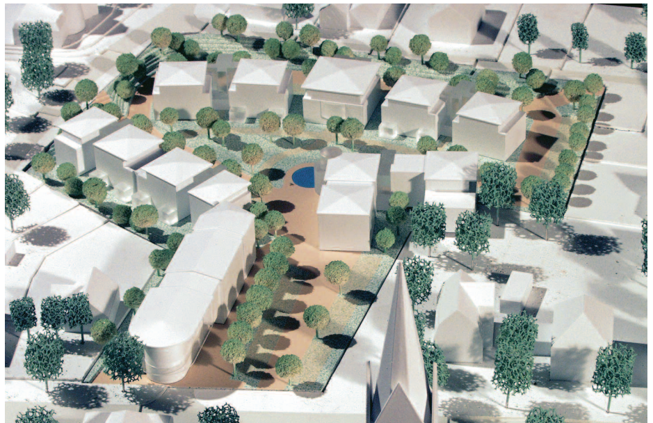
2. Preis: Friesleben und Partner, Düsseldorf · Grundstücksgesellschaft Heinrich Laumann