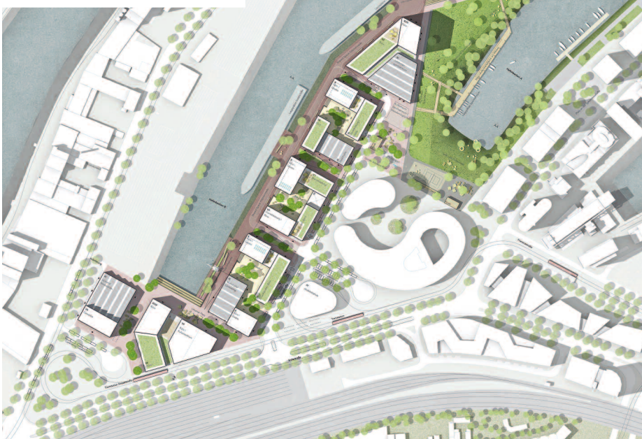
1. Preis DFZ Architekten, Hamburg · Atelier Loidl Landschaftsarchitekten, Berlin