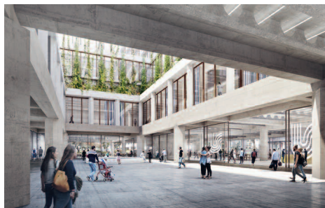
Eingang mit Blick Richtung Farbgarten und Magistrale