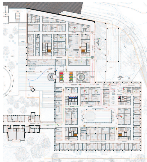
E+1, Etappe 1 M. 1: 1.500