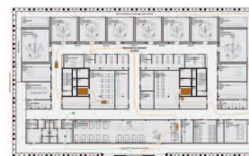
E+4, Etappe 1 M. 1: 1.500