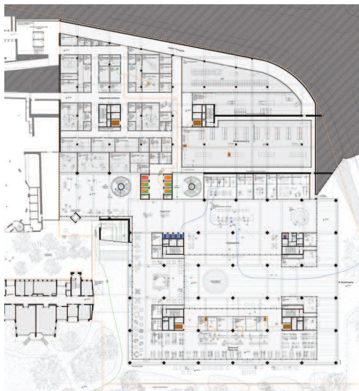
E0, Etappe 1 M. 1: 1.500