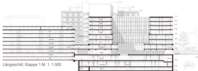
Längsschnitt, Etappe 1 M. 1: 1.500