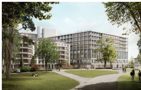
Das neue Stadtspital am Gloriapark

Gewinner /Winner Christ & Gantenbein, Basel · b+p baurealisation AG, Zürich