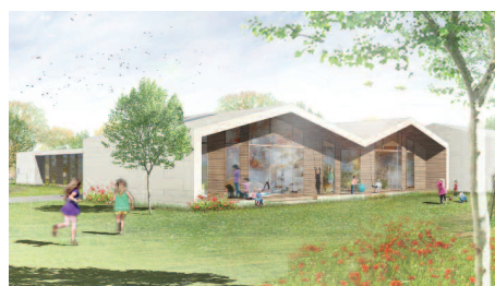
1. Preis Asmussen & Partner GmbH, Flensburg